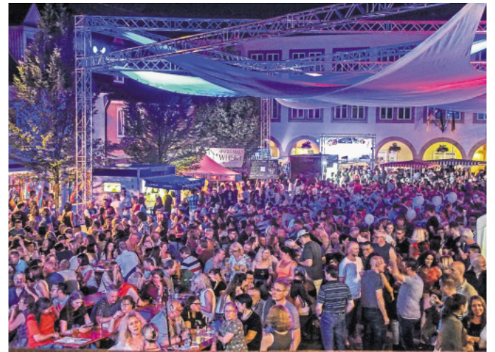
Lebendig und bunt wird es beim Stadtfest wieder zugehen.

Bereits seit elf Jahren ist das Lakeside Open Air am Elbenplatz fester Bestandteil